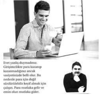
Evet yanlış duymadınız. Girişimcilere para kazanıp kazanmadığınız ancak vasıyetinize belli olur. Bu nedenle para için değil sürdürülebilir keyif almak için çalışın. Para mutlaka gelir ve emin olun mutlaka gider.

- Duygulara Hitap Edin... Yaptığımız iş ile mutlaka duygulara hitap edin. En katı kişiler bile duygusal yönleri vardır. Ürün ya da hizmetinize mutlaka duygular dahil edin. Umutsuzluk, insan iki nokta arasında gider gelir; hız ve acı. Onları mutlu edin. - Duygulara Hitap Edin... Basit bir gerçek; İnsanlar dış dünya ile duygu organları ile iletişime geçerek. O zaman ürün ya da hizmetiniz, mümkün olduğunca 5 duygu organına hitap edebilecek şekildedir tasarlanmalı. Nasıl olur demeyin yaratıcılığınızı kullanın. - Tanışın, Tanıyın... Network gücünüzün iş dünyasında en önemli kavram.